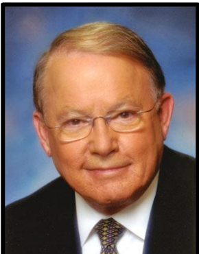
Conférencier M. Bernard Landry